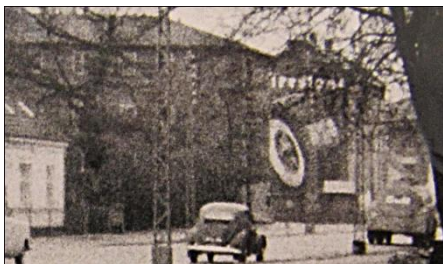
Dækreklame på nr. 16

Vi boede i stuen til højre, lejligheden var en 3½ værelses på 87m 2 . Lejlighederne til venstre havde et ½ værelse mindre, men var ellers næsten identiske.