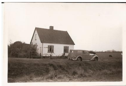
mormor og morfars hus

Huset hvor mormor og morfar boede lå lige overfor trinbrættet, det var et gammelt hus fra 1918. Det var et lille hus på ca. 80 m 2 med udnyttet tagetage, hvor der var et enkelt værelse. Huset havde kun elektricitet